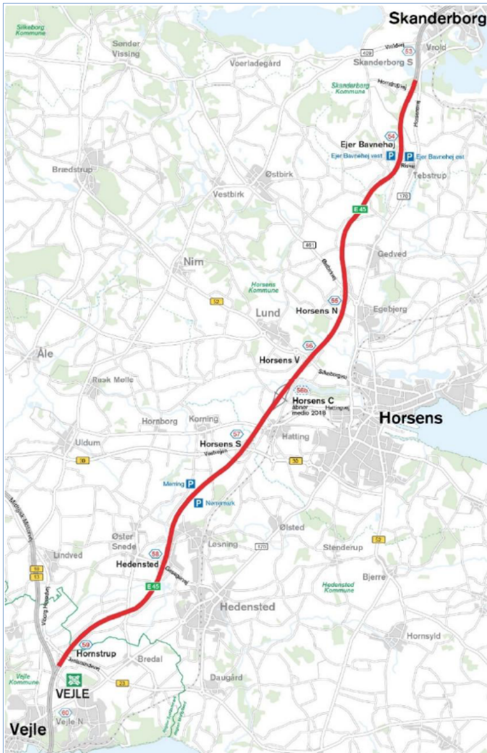
Figur 1. Projektets udstrækning.

På hele strækningen har Vejdirektoratet i dag 41 eksisterende regnvandsbassiner, som skal udvides, sideflyttes eller helt annulleres. Enkelte steder etableres nye bassiner.