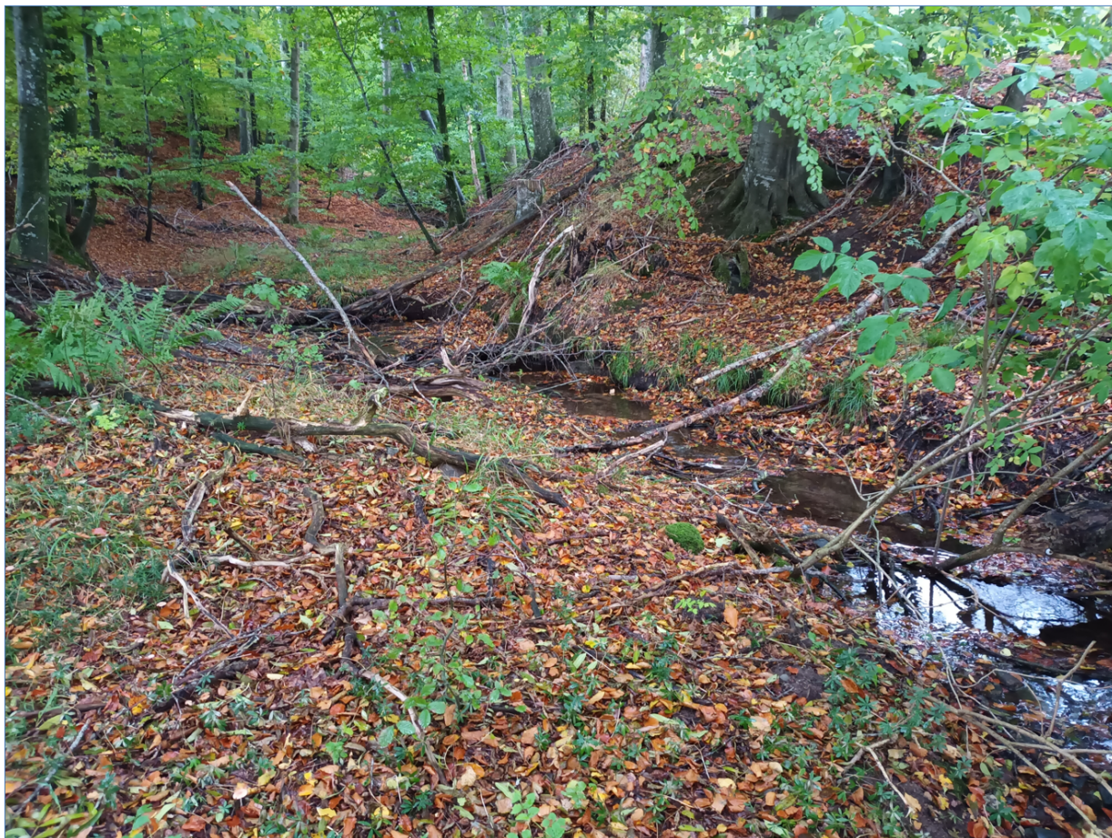
Figur 3. Repræsentativt billede af Ris Bæk nedstrøms og tæt på udløbspunkt UVB22.

Der foreligger ingen vandføringsmålinger i Ris Bæk eller Gedved Mølleå.